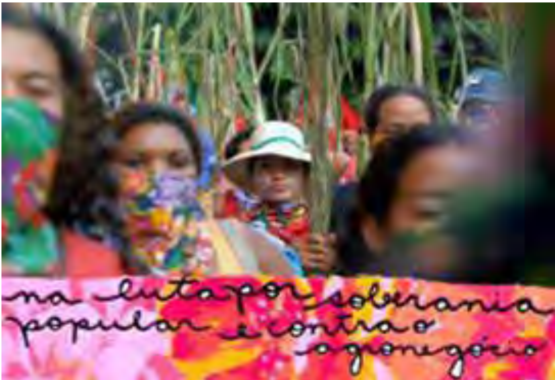
Mulheres da Via Campesina do estado de São Paulo – 2007. Foco: Participação das mulheres da Via na Marcha das Mulheres na Av. Paulista em São Paulo durante a vinda do presidente dos Estados Unidos, George Bush para assinatura de acordo com o Brasil para incentivos aos agrocombustíveis.