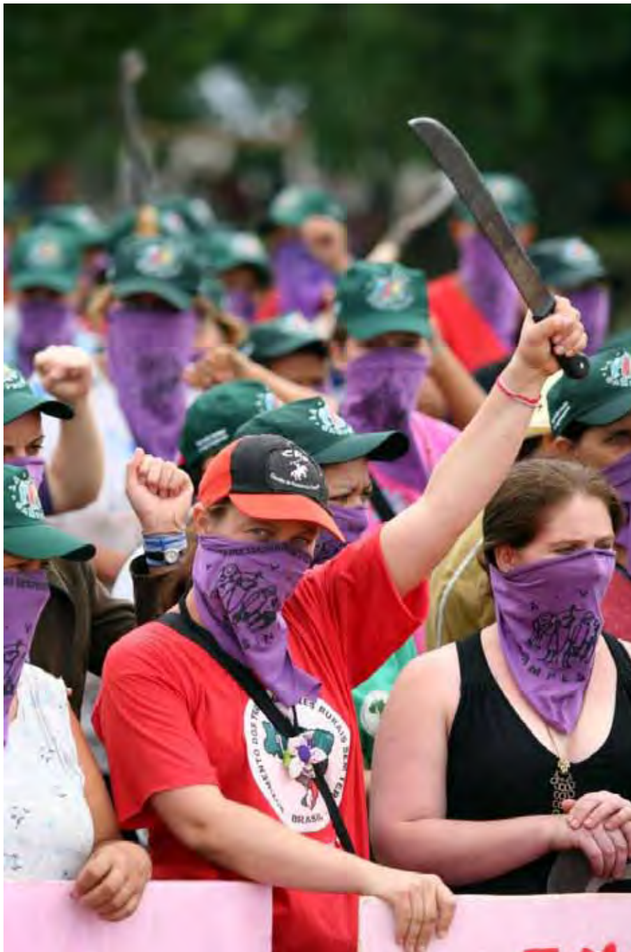
Mulheres da Via Campesina do estado do Rio Grande do Sul – 2008. Foco: luta contra a celulose e o Grupo Stora Enzo.