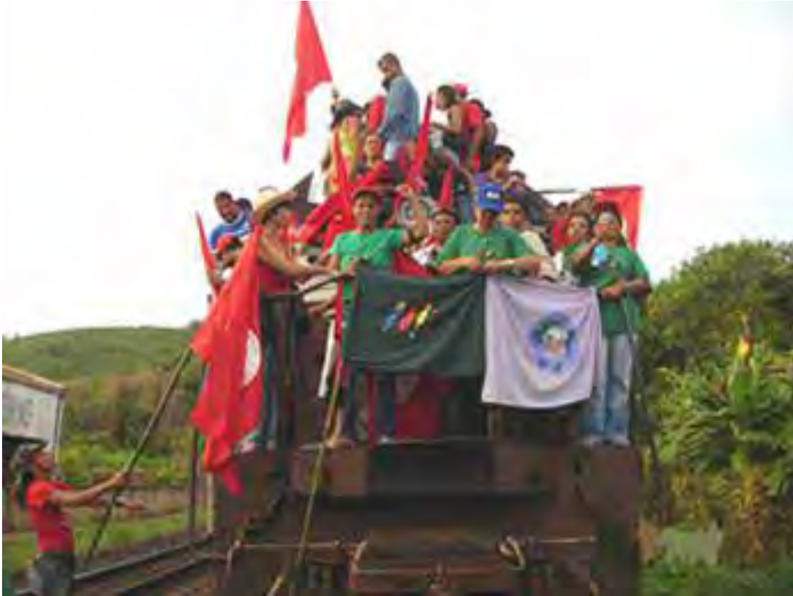
Arquivo MST: Mulheres da Via Campesina no estado de Minas Gerais – 2008. Foco: denúncia sobre os impactos da mineração e contra a construção de barragens / ação: paralisação dos trens da empresa VALE.