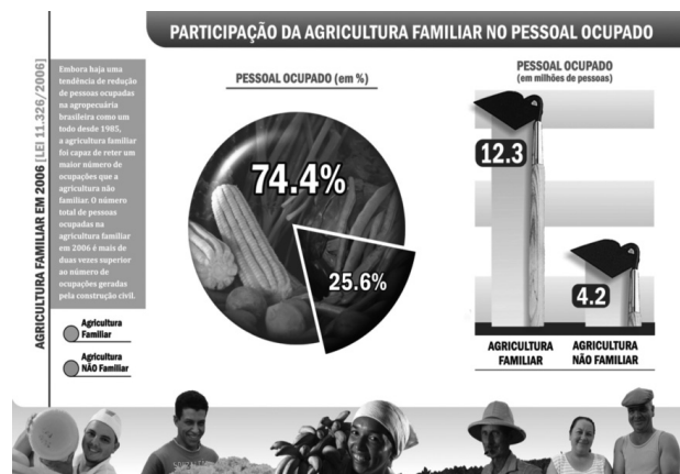
Figure 3: Participação da agricultura familiar no pessoal ocupado.

O Censo confirma séries estatísticas anteriores ao demonstrar que entre 60 a 70% dos alimentos da cesta básica de alimentos do povo brasileiro são produzidos pela agricultura familiar.