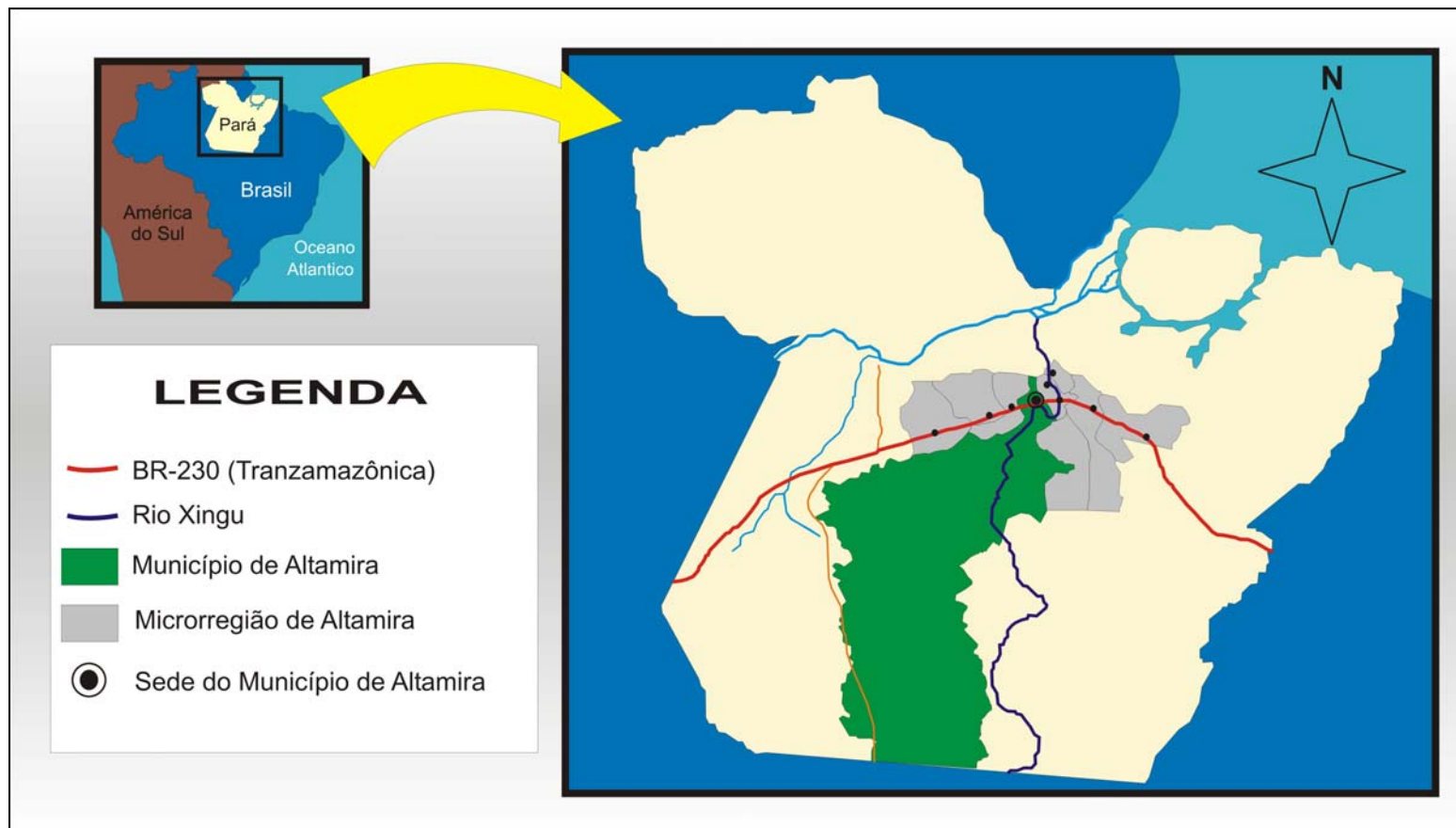
Figura 2 Representação do Complexo dos Municípios que compõe a Região da Transamazônica.